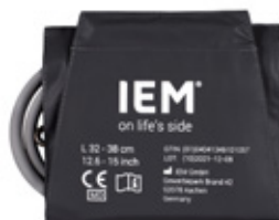
SPABPC03 Mansjett, L (32–38 cm)