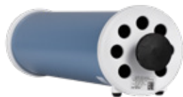
SPCAL30 Kalibreringsprøyte, 3 liter