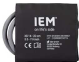
SPABPC04 Mansjett, XS (14–20 cm)