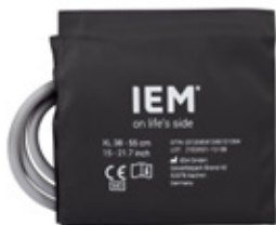
SPABPC05 Mansjett, XL (38-55 cm)