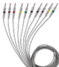
SPEK5-1B Kabel med bananstikker