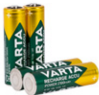
SPABPB02 Fire oppladbare batterier