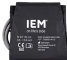
SPABPC02 Mansjett, M (20–24 cm)