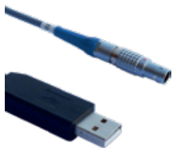
SPK32 4-pins kabel for 24-t blodtrykksmåler