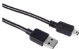
SPK6-1 USB til mini-USB for EKG