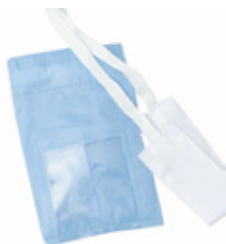
SPABPD12 Engangsveske, 10 stk.