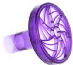
2091-412 Filter, 100 stk.