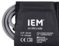
SPABPC01 Mansjett, S (20–24 cm)