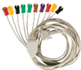
SPEK5-3 Kabel med klype