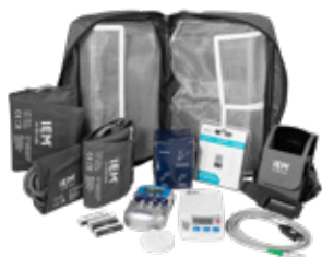
SPABPM21 24-timers blodtrykk-kit