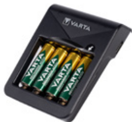
SPABP03B Batterilader med fire batterier