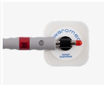
EKG-elektrode til bananplugg