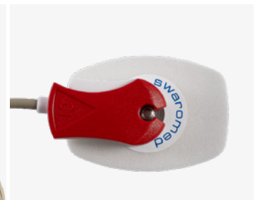
EKG-elektrode med metallknapp